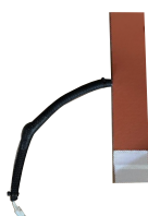
Sistema de precalentamiento A-EGX-PCLTO/AIRE