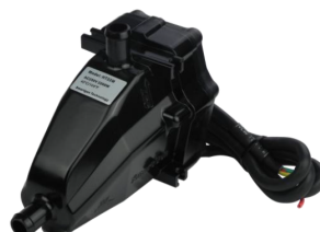
Sistema de precalentamiento Pro A-EGX-PCLTO/LIQ