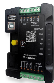
Módulo Wi-Fi A-EGX-WIFI