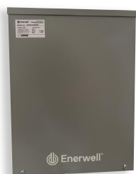
Sistema de transferencia automática (ATS) A-EGX-ATS

A-EGX-PCLTO/LIQ incluido en modelos EGXPRO.